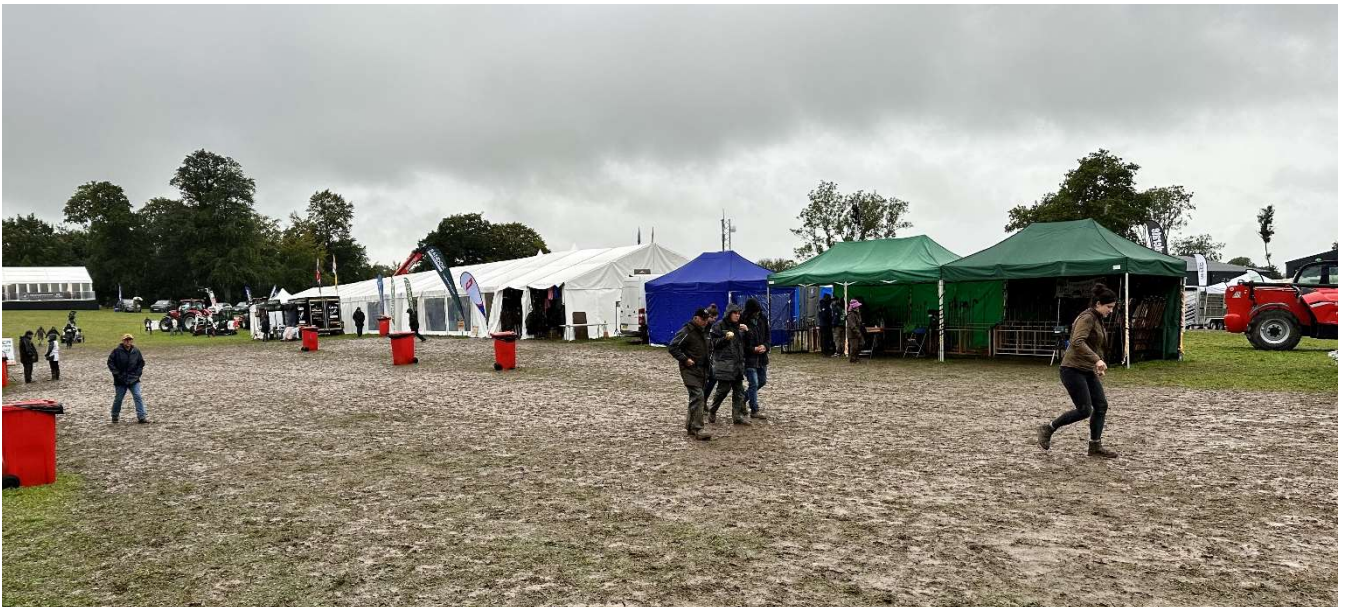
Trotz Matsch herrschte eine tolle Stimmung